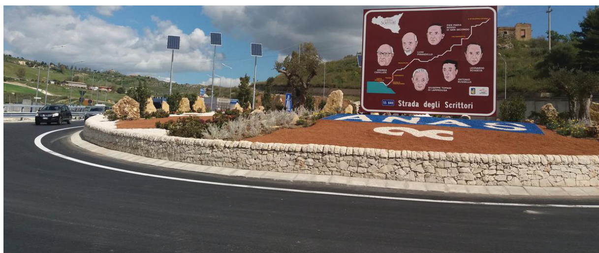
Rotonda accesso “Strada degli Scrittori” ex SS640

Da Agrigento, dove si respira aria di festa, gli iscritti al Master parteciperanno anche alle escursioni lungo le tappe della Strada degli Scrittori. Fra centri piccoli e grandi che consideriamo le “piazze” della Capitale. A cominciare da Porto Empedocle, la Vigata di Camilleri, dalla stessa Girgenti di Pirandello, dalla Racalmuto di Leonardo Sciascia o da Palma di Montechiaro con il convento del Gattopardo di Tomasi di Lampedusa.