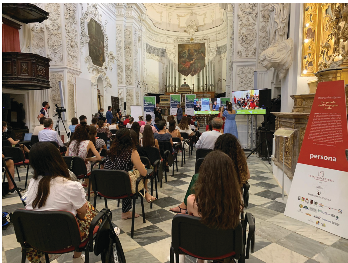
Master di Scrittura 2022

Possono iscriversi giovani di tutte le età, studenti di scuole medie e secondarie, universitari, giornalisti, professionisti, giovani autori, aspiranti scrittori, editori, docenti e appassionati che desiderano approfondire la propria conoscenza nell’ambito della scrittura in genere, chiunque sia interessato ad una analisi del rapporto fra musica e scrittura, musica e arte, musica e tv o cinema, musica e show.